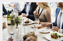
飲食業 インド料理店