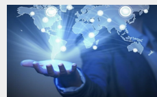
貿易 中古医療機器輸出